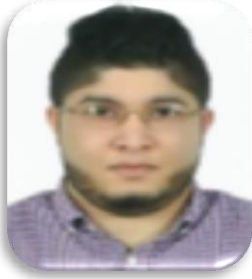
فيروز النعاس 8