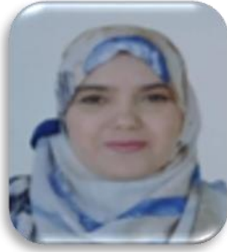
139 هاتف الجبوري