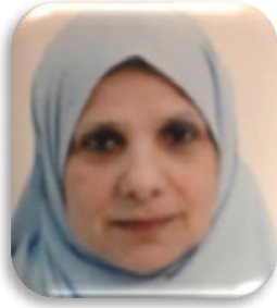
145 نصيرة صبيات