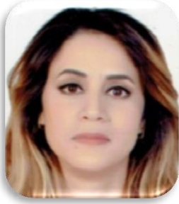
السعيدة لدبس 56