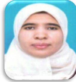
40 وردة برويس