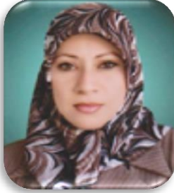
142 حدود الطفيلي