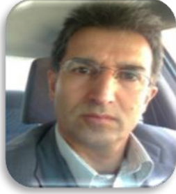
عمران محافظة 21